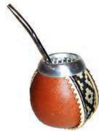
El mate es la bebida nacional.

Si vas a Argentina, puedes visitar La Patagonia y los edificios del Microcentro en Buenos Aires. También puedes visitar parte de otros países porque ¡en Sudamérica hay cosas para ver incluso en las fronteras!