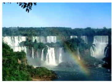
Las impresionantes Cataratas de Iguazú se encuentran entre Brasil, Paraguay y Argentina