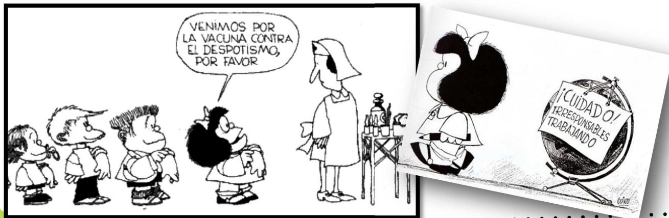
EN MONTAIGNE SE HABLE ESPAÑOL