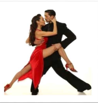
El Tango es el baile típico de Argentina, un baile lleno de sentimiento y pasión