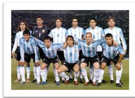
La selección de fútbol de Argentina es una de las mejores del mundo.